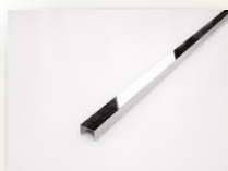
Профиль из Нержавеющей Стали Полированный Pencil Inox Brillo